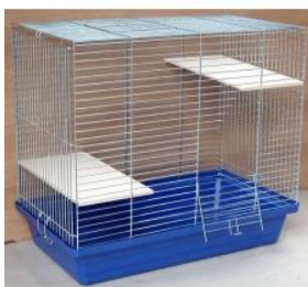
Klec činčila, fretka 80