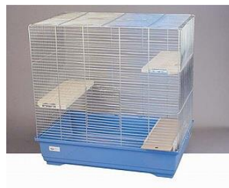
Klec činčila, fretka 100