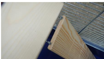
Montáž schůdků (typ Mega)