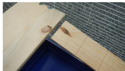
Montáž schůdků (typ Mega)